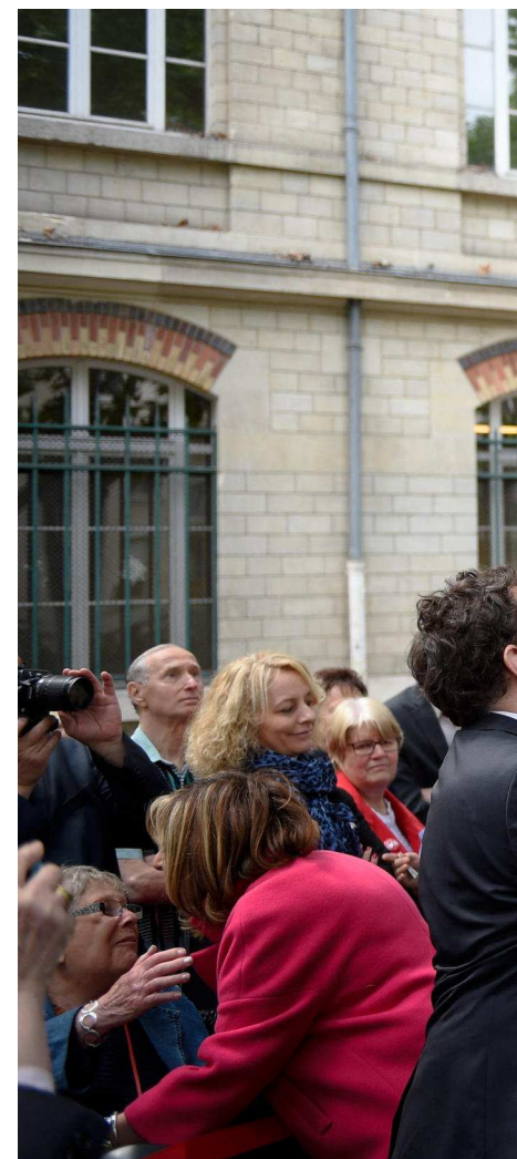
À Paris, de plus en plus d'espaces publics portent le nom de figures féminines. La promenade Dora-Bruder, inaugurée en 2015 (ci-dessus), rend hommage à cette adolescente juive morte en déportation, sortie de l'oubli grâce à un livre de Patrick Modiano.

Le nombre de nouvelles dénominations féminines d'espaces publics à Paris en 2022